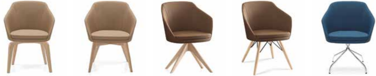
Nr. 01 Nr. 02 Nr. 03 Nr. 04 Nr. 05