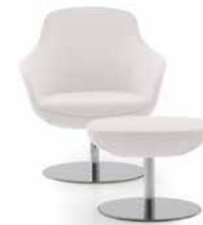
Nr. 04 Hocker auf Anfrage