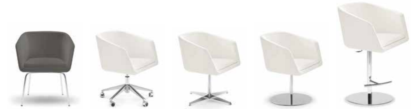
Nr. 06 Nr. 07 Nr. 08 Nr. 09 Nr. 10