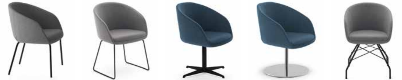
Nr. 06 Nr. 07 Nr. 08 Nr. 09 Nr. 10