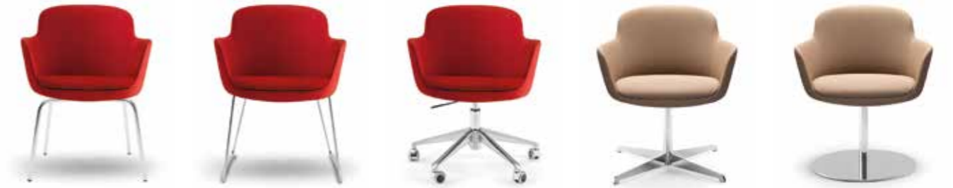
Nr. 06 Nr. 07 Nr. 08 Nr. 09 Nr.10 Bemusterung möglich