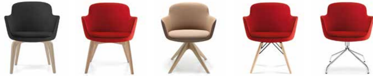
Nr. 01 Nr. 02 Nr. 03 Nr. 04 Nr. 05