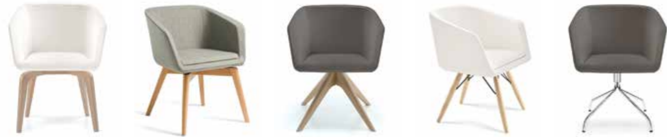
Nr. 01 Nr. 02 Nr. 03 Nr. 04 Bemusterung möglich Nr. 05