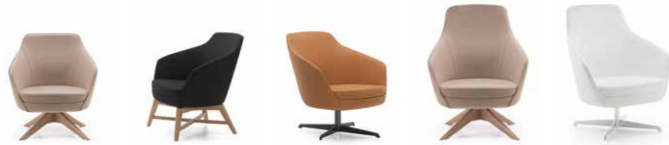
Nr. 01 Nr. 02 Nr. 03 Nr. 04 Nr. 05