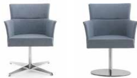
Nr. 05 Nr. 06