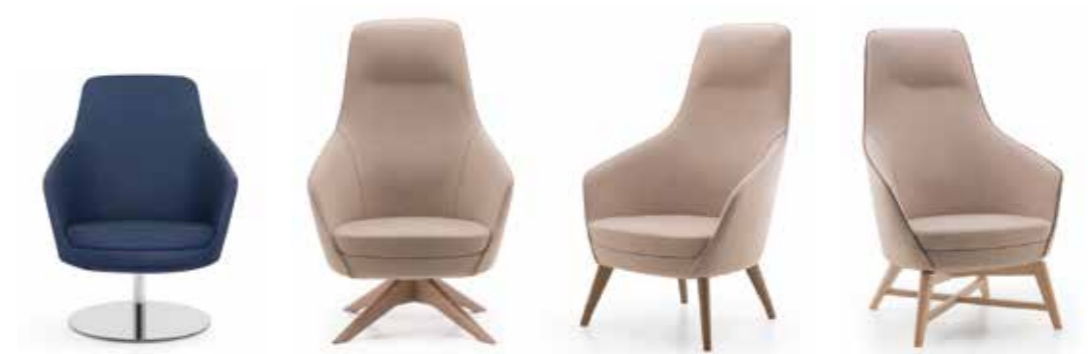
Nr. 06 Nr. 07 Nr. 08 Nr. 09