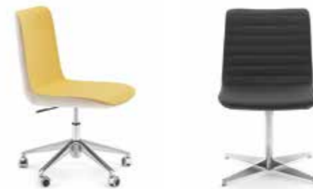
Nr. 06 Nr. 07