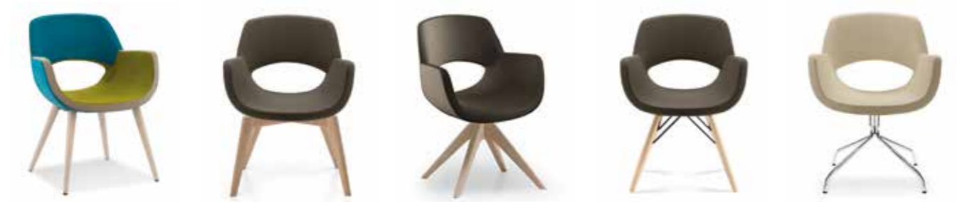
Nr. 01 Nr. 02 Bemusterung möglich Nr. 03 Nr. 04 Nr. 05