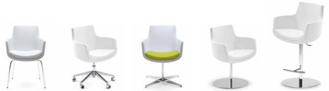
Nr. 06 Nr. 07 Nr. 08 Nr. 09 Nr. 10