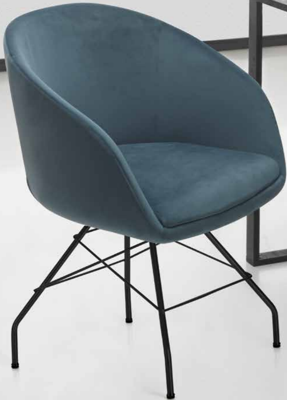
Modell Stuhl Klapp 2514 P15