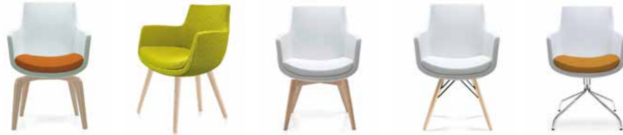
Nr. 01 Nr. 02 Nr. 03 Bemusterung möglich Nr. 04 Nr. 05