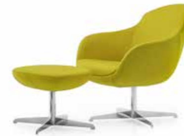
Nr. 03 Hocker auf Anfrage