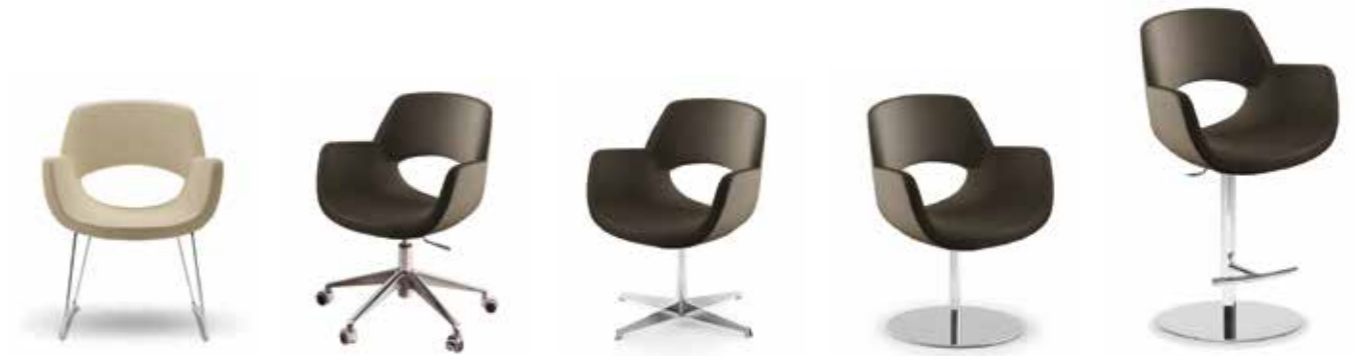
Nr. 06 Nr. 07 Nr. 08 Nr. 09 Nr. 10