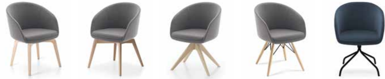
Nr. 01 Nr. 02 Nr. 03 Nr. 04 Nr. 05