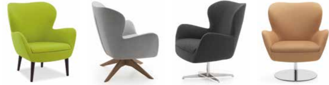
Nr. 01 Bemusterung möglich Nr. 02 Nr. 03 Nr. 04