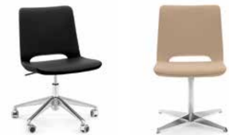
Nr. 06 Nr. 07