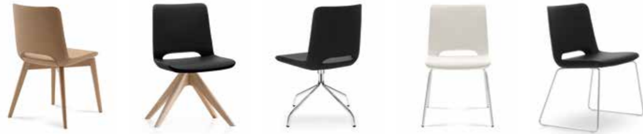
Nr. 01 Nr. 02 Nr. 03 Nr. 04 Nr. 05