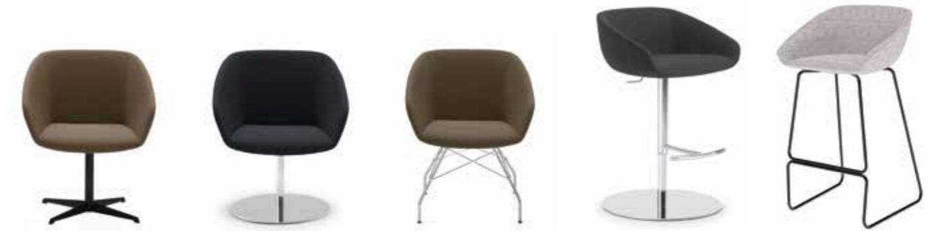
Nr. 06 Nr. 07 Nr. 08 Nr. 09 Nr. 10