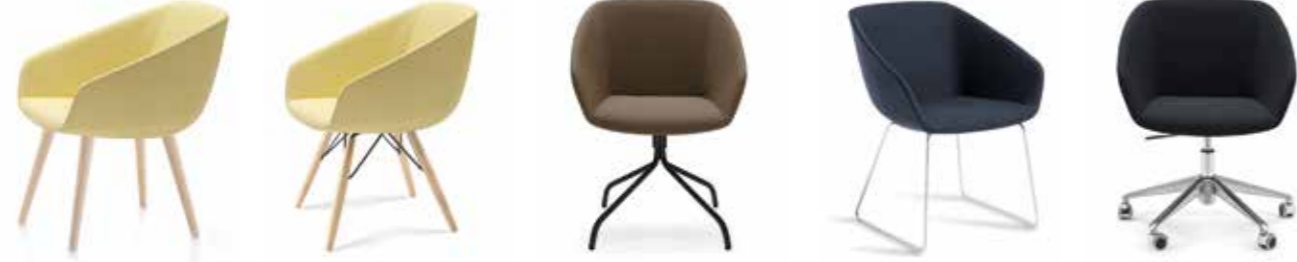
Nr. 01 Nr. 02 Nr. 03 Nr. 04 Nr. 05