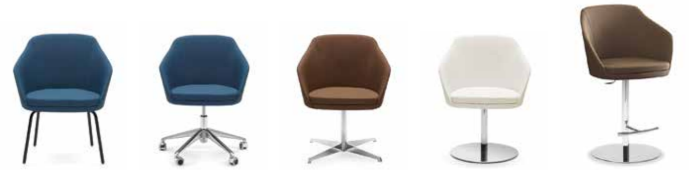
Nr. 06 Nr. 07 Nr. 08 Nr. 09 Nr.10