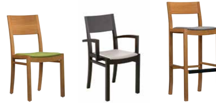
Nr. 01 Bemusterung möglich