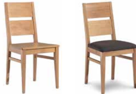
Nr. 01 Bemusterung möglich