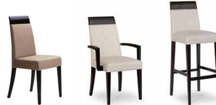
Nr. 01 Bemusterung möglich Nr. 02 Nr. 03