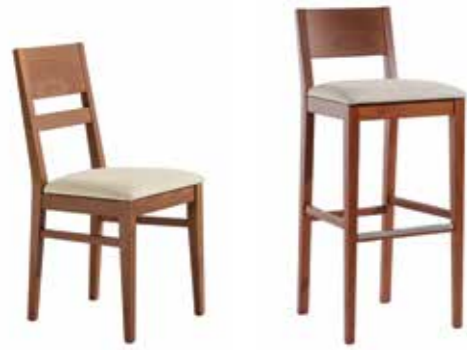
Nr. 01 Bemusterung möglich Nr. 02