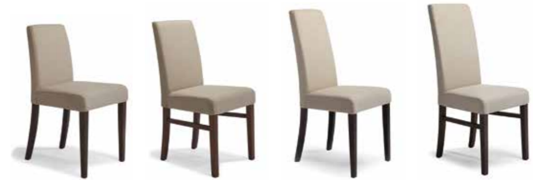
Nr. 01 Nr. 02 Bemusterung möglich Nr. 03 Nr. 04