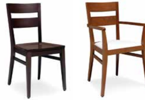
Nr. 01 Nr. 02