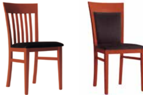
Nr. 01 Nr. 02