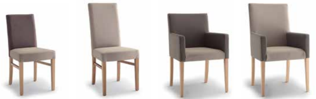
Nr. 01 Nr. 02 Bemusterung möglich Nr. 03 Bemusterung möglich Nr. 04