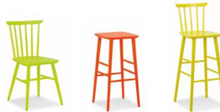
Nr. 01 Nr. 02 Bemusterung möglich Nr. 03 Bemusterung möglich