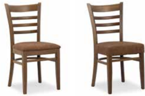
Nr. 01 Nr. 02