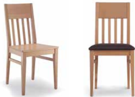
Nr. 01 Bemusterung möglich