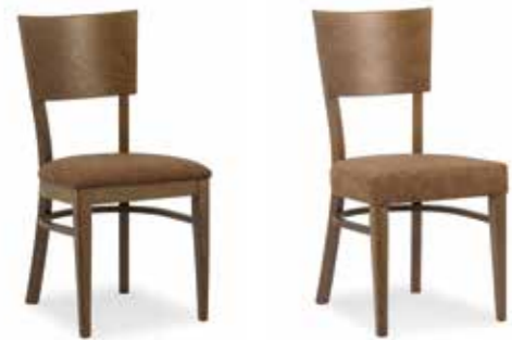
Nr. 01 Nr. 02