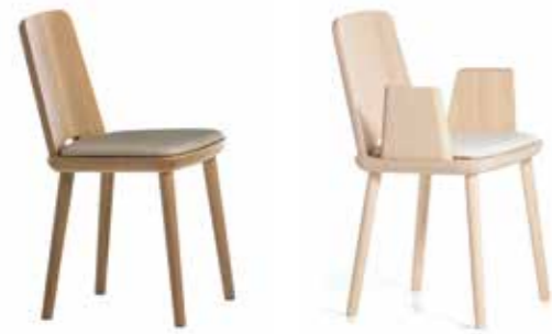
Nr. 01 Bemusterung möglich