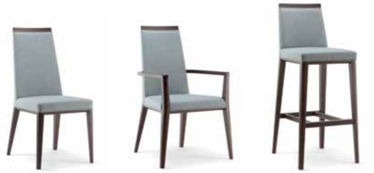
Nr. 01 Bemusterung möglich Nr. 02 Nr. 03