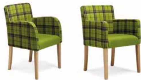
Nr. 01 Nr. 02