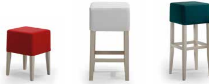
Nr. 01 Nr. 02 Nr. 03