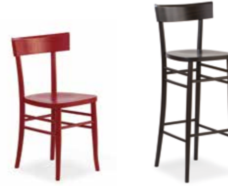
Nr. 01 Bemusterung möglich Nr. 02