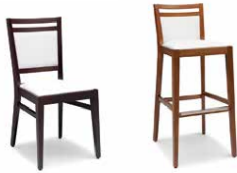
Nr. 01 Nr. 02