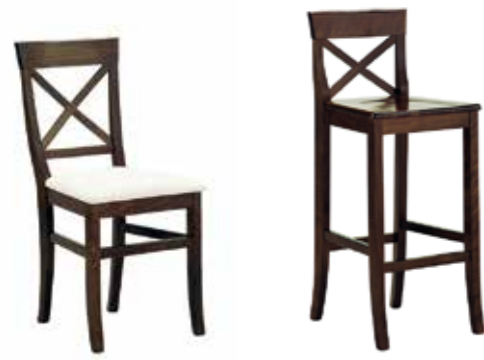
Nr. 01 Bemusterung möglich