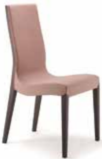
Nr. 01 Bemusterung möglich