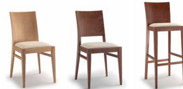
Nr. 01 Bemusterung möglich Nr. 02 Nr. 03