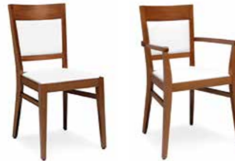
Nr. 01 Nr. 02