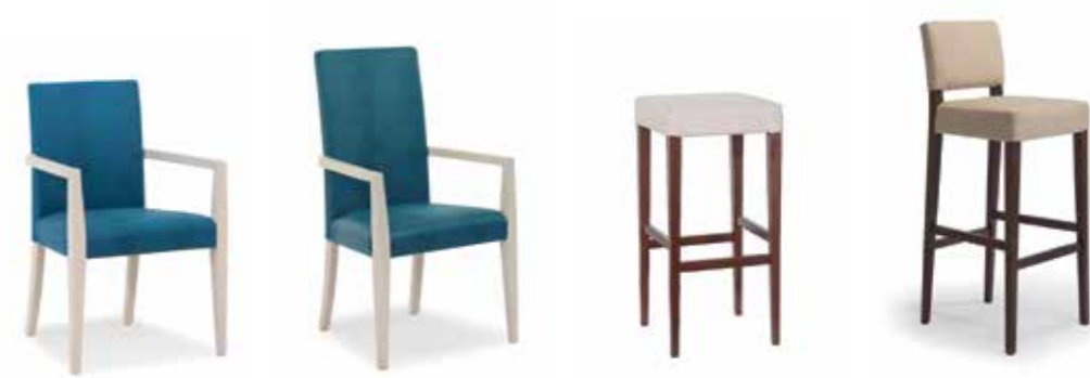
Nr. 05 Nr. 06 Nr. 07 Nr. 08