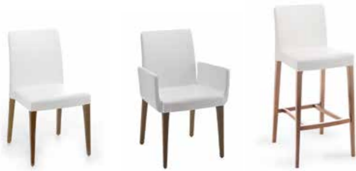
Nr. 01 Bemusterung möglich Nr. 02 Bemusterung möglich Nr. 03