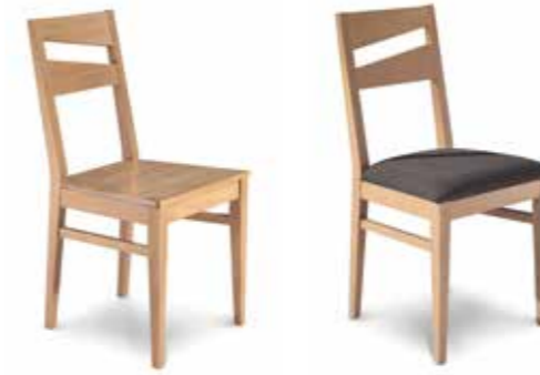
Nr. 01 Bemusterung möglich