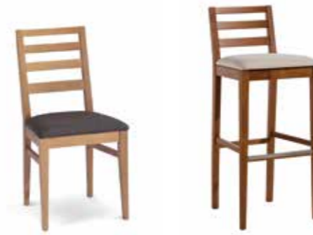
Nr. 01 Bemusterung möglich