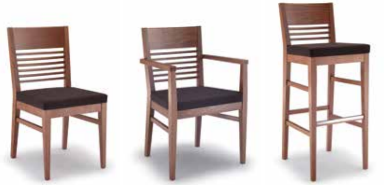
Nr. 01 Bemusterung möglich Nr. 02 Bemusterung möglich Nr. 03