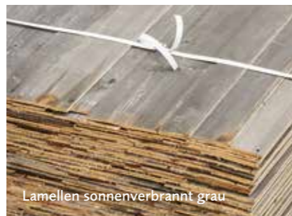
Lamellen sonnenverbrannt grau