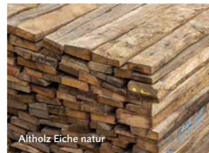
Altholz Eiche natur